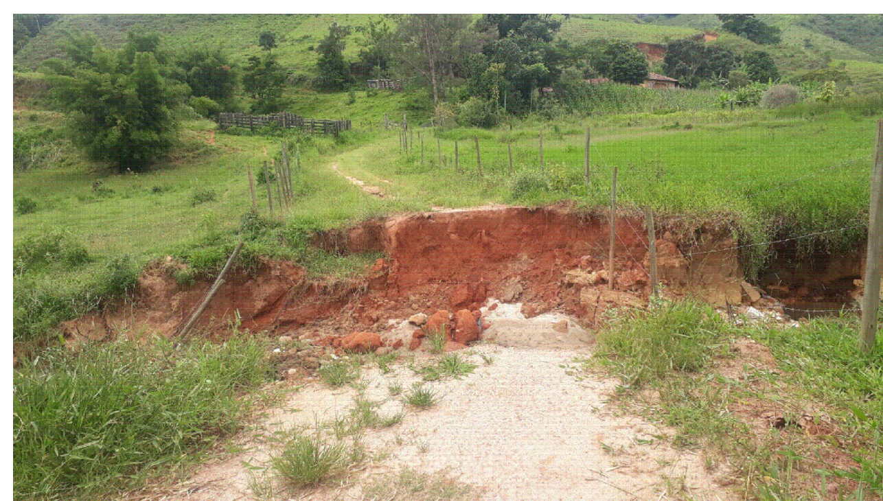
Localização Comunidade Maiais (42°33'46.62"O e 20°19'28.29"S)